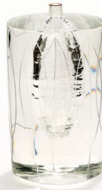
Yoichi Ohira, Scapelle, 2008

In Halle 9, TECHNE SPHERE LEIPZIG, two famous architects are honoured: Carlo Scarpa (1906 – 1978) and Tomaso Buzzi (1900 – 1981). Until 31/3/2021, selected objects produced according to their designs will be on view.