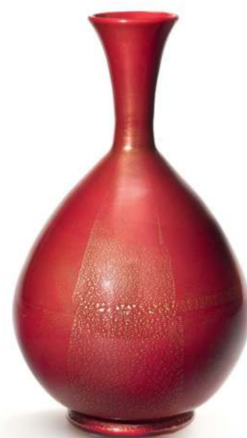
Carlo Scarpa, Vase, Pasta Vitrea, M.V.M. Cappellin, 1929

MI 31.03.2021 / 18:00 FINISSAGE Galerie Halle 9 der TECHNE SPHERE LEIPZIG