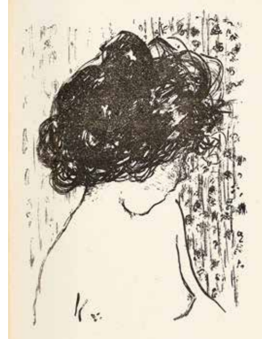
Pierre Bonnard, Lithografie aus: Peter Nansen, Marie , Paris: Revue Blanche, 1898