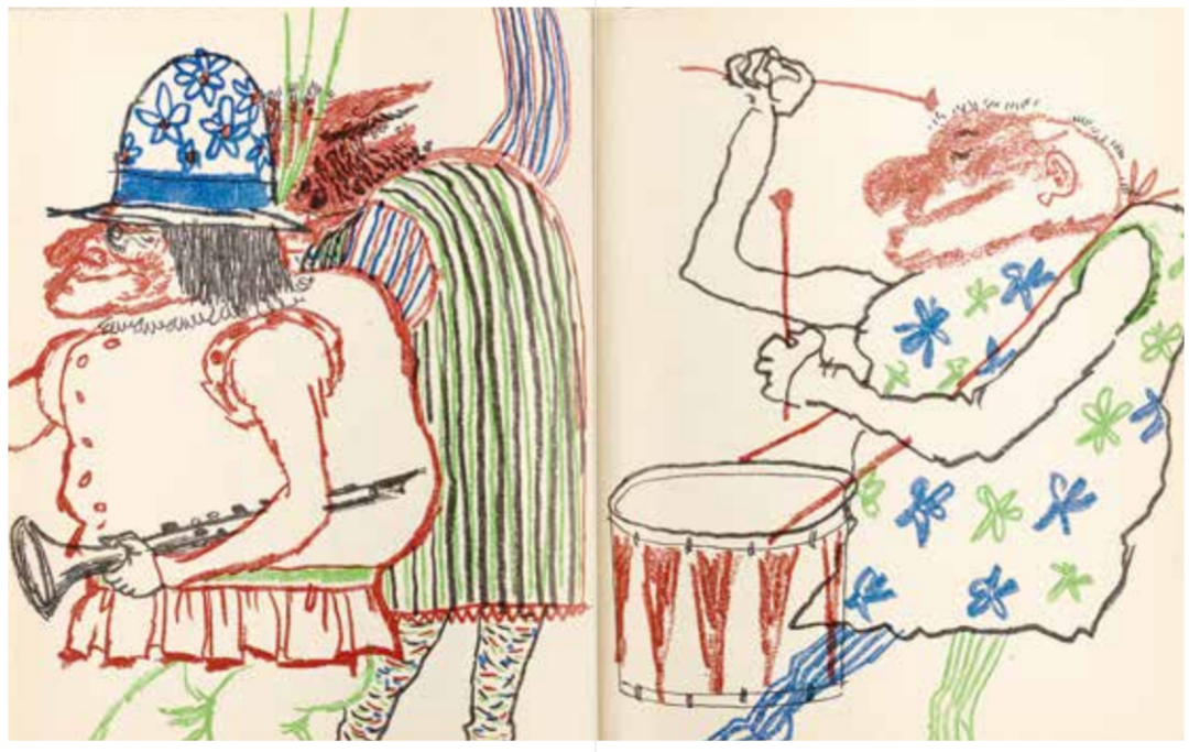
Werner Klemke, Die drei Buckligen aus: Werner Bahner, Neue Beleuchtungen und fröhliche Plaudereien , 1962

Accompanying the exhibition is a publication From Bonnard to Klemke. Illustrated Books and Portfolio Works from the Wieland Schütz Collection , ed. by Olaf Thormann, Leipzig: Faber & Faber 2023 (300 p., German/English, approx. 39 Euro, ISBN 978-3-86730-256-2, available in bookstores and the museum shop).