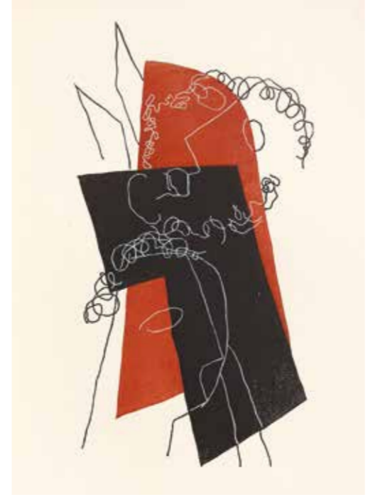
Henri Laurens, Farbhologisch aus: Lucien de Samosate, Diologues , 1951 © VG Bild-Kunst, Bonn 2023