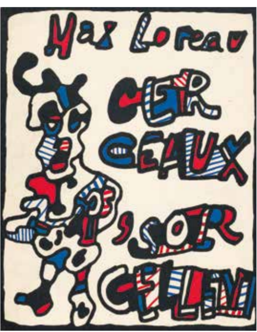
Jean Dubuffet, Einband zu: Max Loreaux, Cercueux , Sorcellien, 1997 © VG Bild-Kunst, Bonn 2023

GRASSI Museum für Angewandte Kunst Leipzig Museum of Applied Arts Leipzig