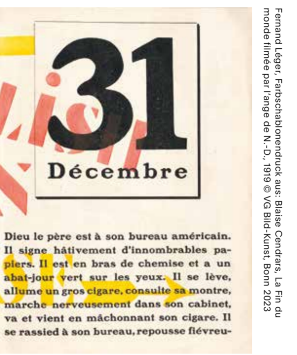
Fernand Léger, Farbschablonendruck aus: Gilise Cendras, La Fin du monde linéaire par l'ange de N.-D. , 1919 © VG Bild-Kunst, Bonn 2023