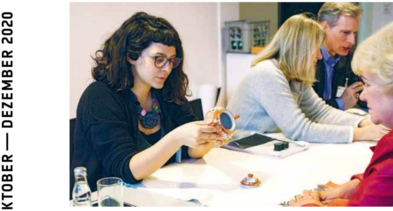
Seit etwa 20 Jahren findet die Veranstaltung »Trüdel oder Kostbarkeit« im Museum statt. Zweimal pro Jahr sind Interessenten herzlich eingeladen, daran teilzunehmen.

Di, 06.10./15:00–18:00 TRÜDEL ODER KOSTBARKEIT? EXPERTEN BEGUTACHTEN IHRE MITGEBRACHTEN KUNSTGEGENSTÄNDE Porzellan, Schmuck, Bücher, Textil, Holz, Asiatika, Glas und Keramik (bitte max. drei Stücke mitbringen, keine Voranmeldung erforderlich, ermäßigter Museumseintritt ist zu zahlen)