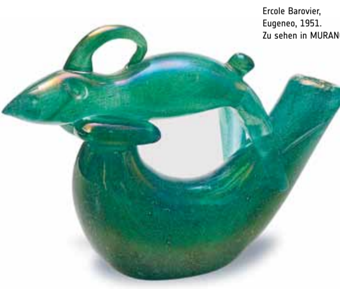
Ercole Barovier, Eugenio, 1951. Zu sehen in MURANO

EINTRITTSPREISE Bis einschließlich 18 Jahre frei Erwachsene 8 € (ermäßigt 5,50 € bzw. 4 €) Abendticket (ab 17:00 Uhr): 4 € Gruppen ab 8 Personen: 6 € p. P. Tickets gelten für alle Sonderausstellungen und die drei Ständigen Ausstellungen. BIBLIOTHEK: Nutzung kostenfrei