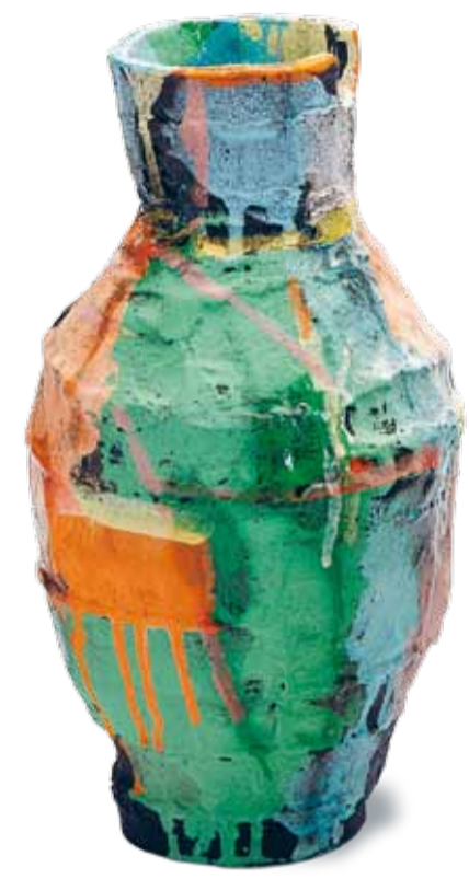
Elke Sada, Gefäß, 2020, Terra Nigra Ton, Engoben, Glasur. Zu erwerben auf der GRASSIMESSE

Bitte halten Sie sich beim Museumsbesuch an die aktuell geltenden Hygienemaßnahmen (Mund-Nasen-Maske tragen, Hände desinfizieren, Abstand von 1,50 m Abstand wahren). Wir danken Ihnen. Die Teilnehmerzahlen für viele Veranstaltungen wie Führungen sind zwar begrenzt, eine Voranmeldung ist dennoch nicht notwendig. Bei Workshops bitten wir um eine vorherige Anmeldung per Mail unter grassimak-kreativ@leipzig.de