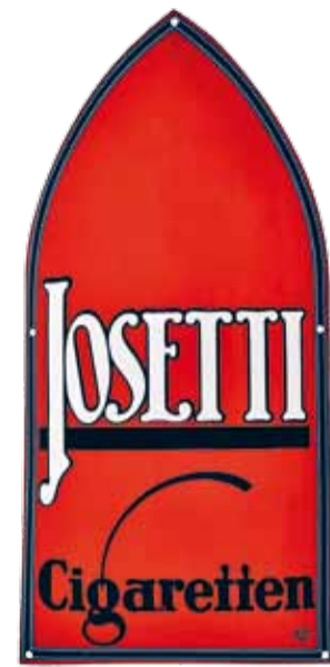
Joseetti Zigarettenfabrik Meier & Peters, Berlin, Entwurf: Erich Lüdke, 1914 Ausführung: Boos & Hahn KG Emaillier- und Stanzwerk, Ortenberg. Zu sehen in REKLAME!

REKLAME! VERFÜHRUNG IN BLECH SOFT OPENING AM 25.11. VON 18 BIS 21 UHR Werbung ist so alt wie Produktion und Handel. Im Wettbewerb um Kunden waren schon immer Fantasie und Kreativität gefragt, aber erst die explosionsartige Vermehrung der Waren durch die industrielle Revolution hat der Werbung – die damals noch Reklame hieß – zum großen Aufschwung verholfen. Emaillierteschilder waren nur ein Bereich der ab 1900 aufblühenden Werbebranche, aber sie waren und sind die wohl langlebige Variante. In ihrer künstlerischen Entwicklung nahe am Papierplakat, dienten die farbenfrohen Emaillierteschilder als Dauerreklame an Fassaden rund um Geschäftseingänge und -türen. Auch wenn sie in erster Linie das urbane Erscheinungsbild für Waren und Dienstleistungen. Gezeigt werden rund 300 Emaillierteschilder aus der Sammlung von Sonja und Gert Wunderlich / Leipzig. Sie bieten einen Überblick auf Produktwerbung zwischen 1890 und den späten 1930er Jahren. Der Bogen spannt sich vom einfachen informativen Türschild bis zu künstlerischen Großformaten, hinter denen häufig berühmte Künstler*innen ihrer Zeit stehen. Bereichert wird die Sammlung durch weitere Werbeatikel, Warenautomaten und zeitgenössische Bild- und Schriftdokumente.