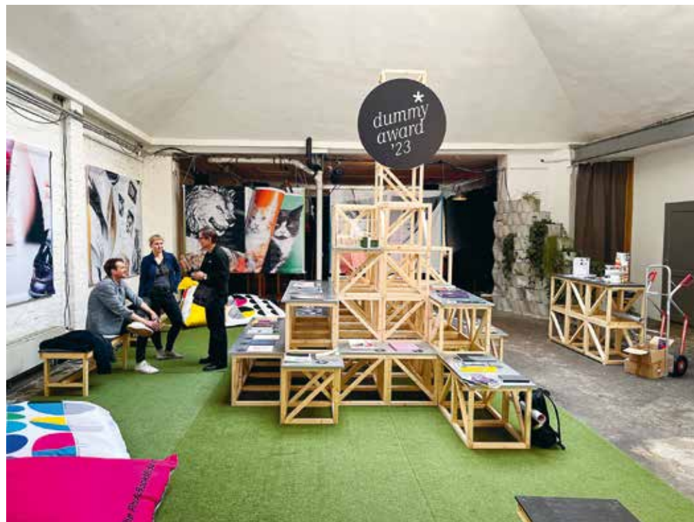
Dummy Award Ausstellung im Exhibition in PhotoBookMuseum in Köln.

eigensinn Publishing (DE), EIKON (AT), Editions du Caïd (BE), Essarter Éditions (FR), Ferdows Faghir (AF/NL), Fotobus Society (DE), Fotoklassen der HGB Leipzig (DE), f/stop Leipzig (DE), Fotohof (AT), Hartmann Books (DE), Homeparkpress (DE), INAPA (DE), Klasse Buchkunst der Burg Giebichenstein (DE), Lotta Bindery - Books (IT), Lzpbooks (US), March and Stone books (ES), Peter Paul Lorenz (DE), Sayo Senoo (FR), Self Publishers United (NL), Stockmans Art Books / HOPPER&FUCHS (BE), Sylvia Mikulik / Ulf Leuteritz (DE), The Angry Bat (SL), Tom Klein (DE), Shushushushu (DE/CN), Uwe Klos (DE), Verlag Kettler (DE), Verlag Marian Arnd (DE), Yogurt Editions (IT).