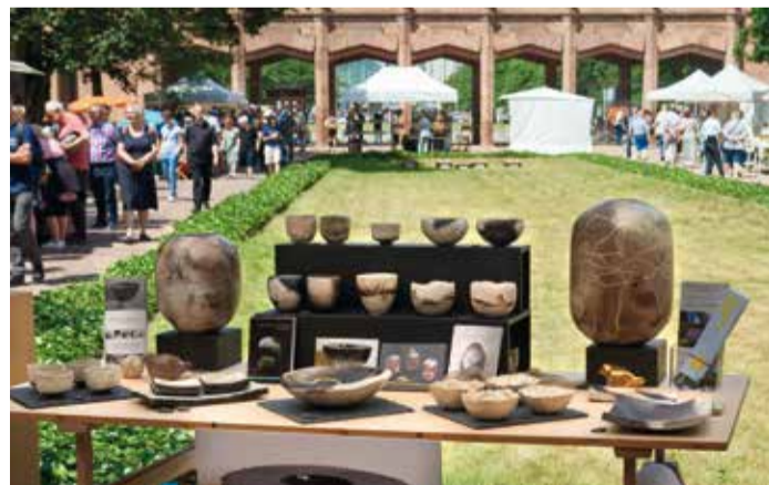
Keramikmarkt Leipzig im Grassi

150 JAHRE MODERNE ILLUSTRATIONSKUNST. Durch die Sonderausstellung VON BONNARD BIS KLEMKE. Mit Kunstvermittlerin Almut Zimmermann