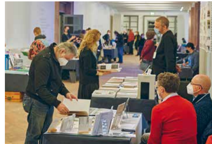
Stände des Photobook Festivals im Foyer, 1. OG

Auch dieses Jahr heißt es im GRASSI wieder »nachts im Museum«. Neben über 80 weiteren Einrichtungen in Halle und Leipzig laden die drei Museen im GRASSI ihre Besucherinnen und Besucher, egal ob alt oder jung, zu einem nächtlichen Museumsrundgang ein. Es werden Führungen durch die Dauerausstellungen und Sonderausstellungen, den alten Johannisfriedhof und ein Architekturrundgang angeboten. Außerdem kann ein besonderer Blick hinter die Kulissen des Museums für Angewandte Kunst geworfen werden. Die Restaurierungswerkstätten öffnen ihre Türen, aber auch kreative Mitmachangebote für Familien, Performances und sogar ein »Escape Game« in der Pfeilerhalle komplettieren das Abendprogramm. Musik von DJ Schellack und ein diverses gastronomisches Angebot laden die Gäste zum Verweilen ein.