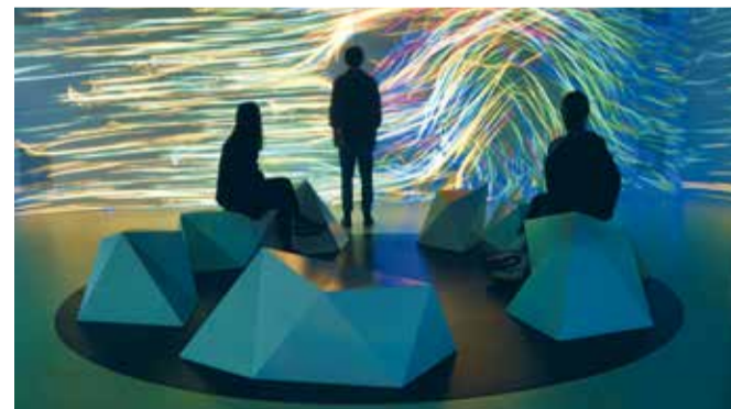
Blick in die Sinneslandschaften

Im vergangenen Jahr erhielt der 360°-interaktive Raum »Sinneslandschaften« ein grundlegendes Update. Neue Bilder und Sequenzen wurden eingespielt, der Raum erhielt eine neue Soundinstallation sowie neues technisches Equipment.