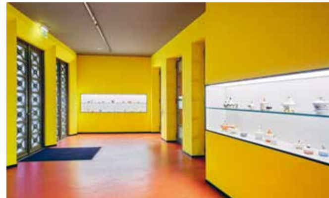
Das neue Studiofoyer