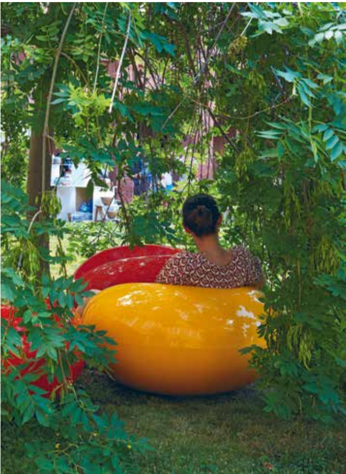
Ab April laden die farbenfrohen, von Eero Aarnio 1967 entworfenen »Pastil Chairs« zum Platznehmen im begrünten Innenhof ein.