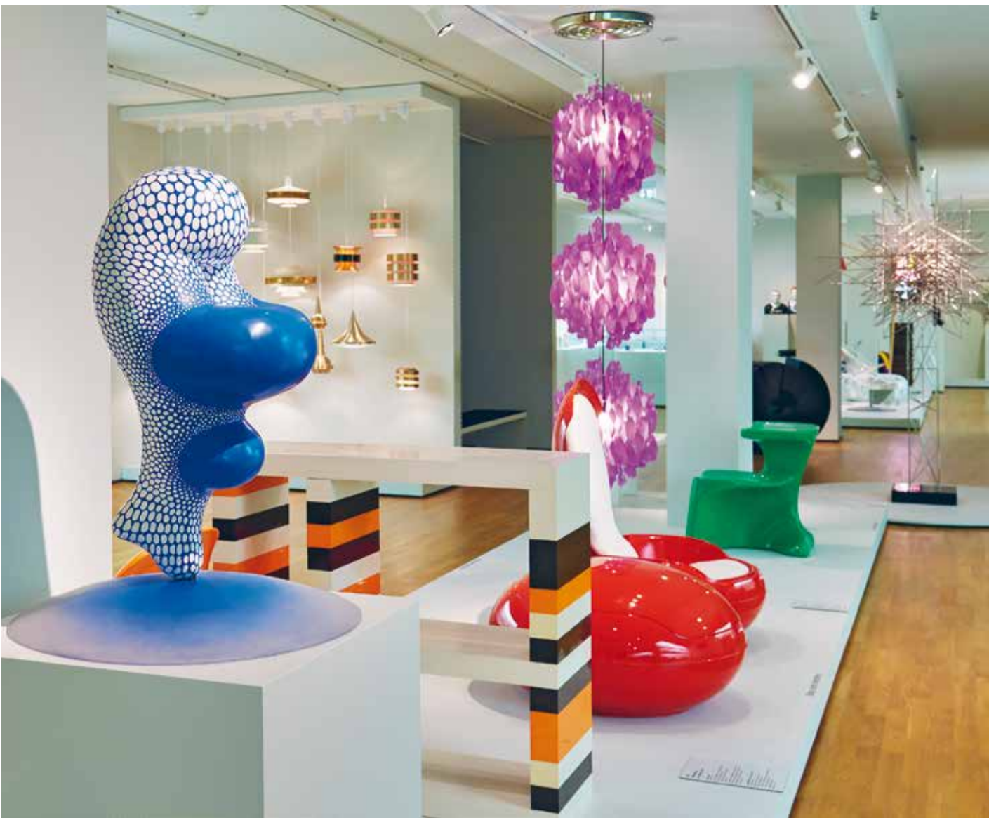
Neu in die Ständige Ausstellung JUGENDSTIL BIS GEGENWART integriert: Venus III, Bussi Buhs, 1967/68, glasfaserverstärkter Polyester, laminiert

Eine Jahreskarte für das GRASSI Museum für Angewandte Kunst ist für 30 € (ermäßigt 21 € bzw. 15 €) erhältlich. Mitglieder des Freundeskreises gehen 12 Monate im Jahr kostenfrei ins Museum. www.freundeskreis.grassimuseum.de