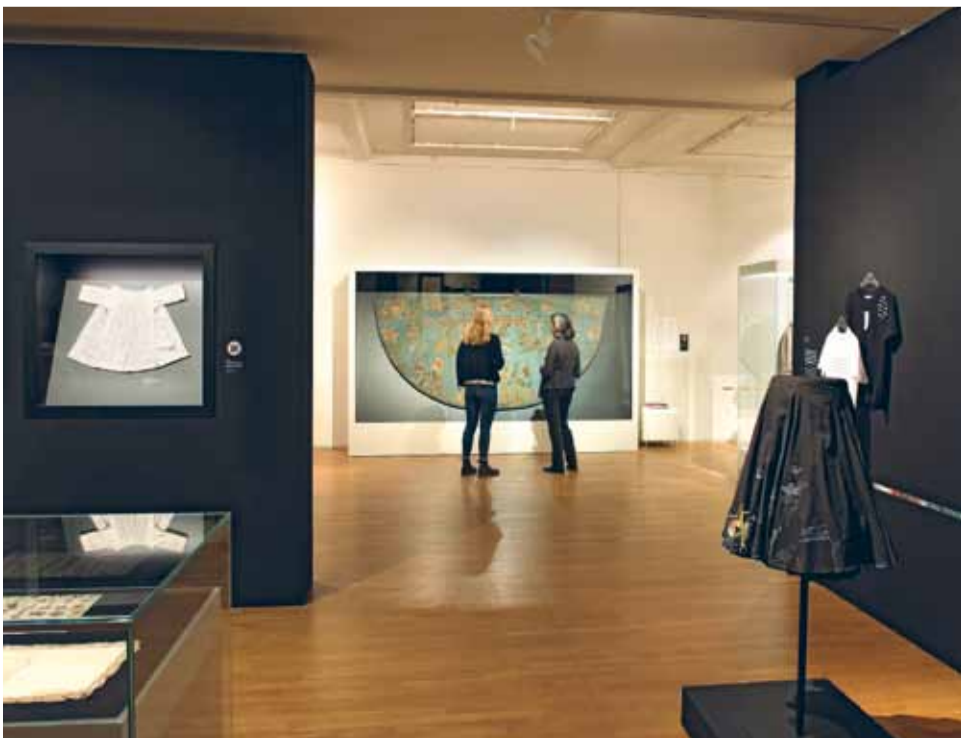
Besucherinnen in der Sonderausstellung HISTORY IN FASHION

ABENDWERSTATT WILDE BLUMENMUSTER IM GRÄTENSTICH Inspiriert von Stickereien der letzten 1500 Jahre werden kleine Taschen mit selbst entworfenen Motiven und verschiedenen Sticktechniken eigenhändig veredelt. Eigene Textilien können mitgebracht werden; mit Antje Ingber (10 € und 5–10 € Materialkosten) ☛ Anmeldung: grassimak-kreativ@leipzig.de