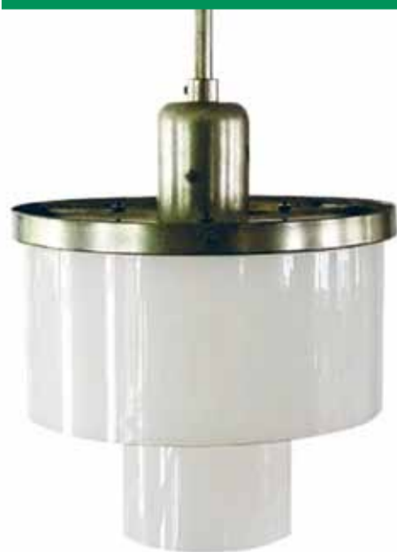
Doppelzylinderleuchte (Modell 806), Entwurf: Marianne Brandt und Helmut Schulze, 1928/29, Ausführung: Körting & Mathiesen, Leipzig-Leutzsch, 1928 bis mindestens 1939, Messing; Opalglas Ständige Leihgabe der Ernst von Siemens Kunststiftung seit 2020 Neu zu sehen in der Ständigen Ausstellung JUGENDSTIL BIS GEGENWART