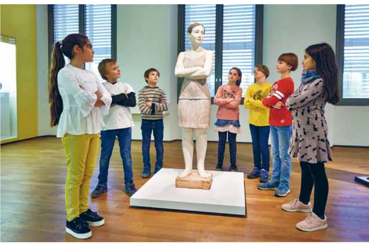
Kinder in der Ständigen Ausstellung ANTIKE BIS HISTORISMUS

Während öffentlicher Veranstaltungen werden zum Teil Audio-, Foto- und Videoaufnahmen für das Museum erstellt. Bitte sprechen Sie uns an, wenn Sie mit einer Veröffentlichung der Aufnahmen nicht einverstanden sind. Andernfalls gehen wir von Ihrer Zustimmung aus. Herzlichen Dank.